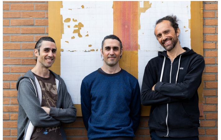
La compagnie