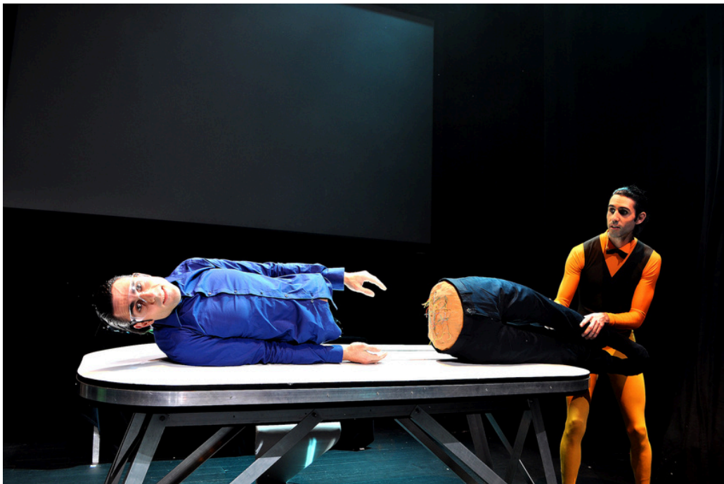
FULL HD

Ainsi, des objets du quotidien se métamorphosent au simple contact d'une télécommande ; un vêtement apparaît instantanément sur le corps, ajusté à la situation ou à l'humeur du moment ; un personnage se téléporte, se duplique, ou se coupe en deux grâce à un rayon laser pour remplacer ses jambes bioniques.