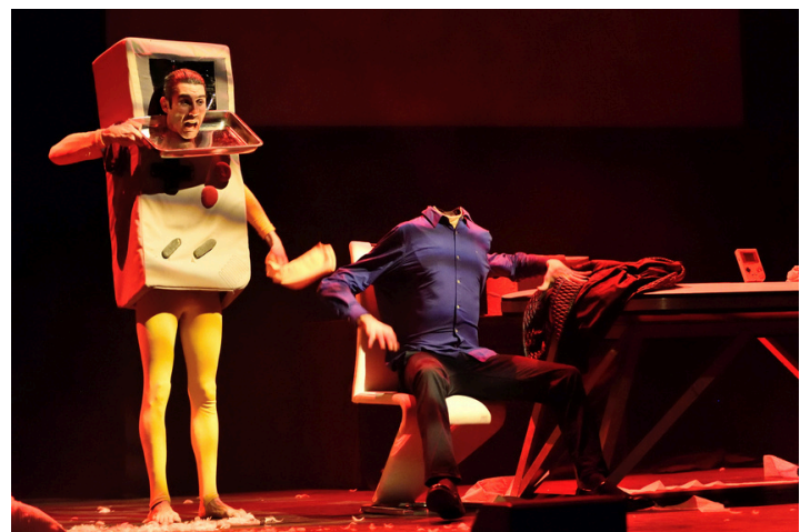
FULL HD