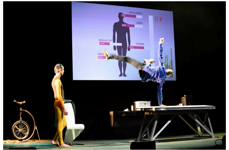
FULL HD

Entre magie nouvelle et théâtre visuel, Full HD AUGMENTED devient un récit visuel sur la technologie devenue reflet dévorant et sur la perte d'humanité dans un monde obsédé par la performance.