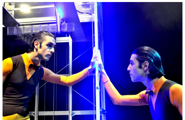
FULL HD