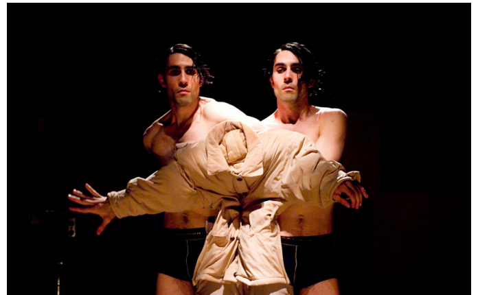
My otro yo