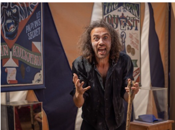
Chapiteau Magique